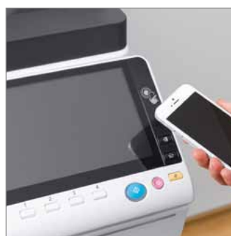
Nova área para Near Field Communication (NFC) Authentication