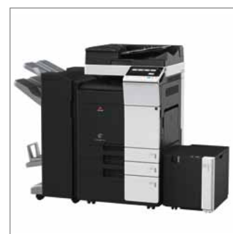
Configurado com FS-534SD Finisher, PC-410 Tray, LU-302 Large Capacity Tray, and DF-704 Document Feeder